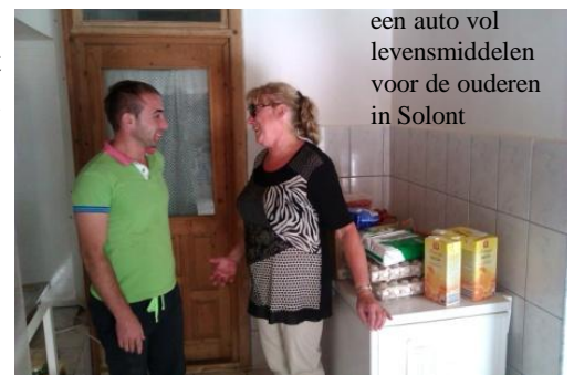
een auto vol levensmiddelen voor de ouderen in Solont

begin niet alles even soepel waardoor er een vertraging ontstond maar eindelijk kon er begonnen worden en we zijn tot nu toe erg tevreden over de manier van werken, de communicatie enz. Roemenië is en blijft een erg bureaucratisch land en dat is te zien aan alle stempels die er op de tekeningen en formulieren worden geplaatst. Het houdt enorm op om alle stempels te bemachtigen, het is nu eenmaal een Roemeens systeem en dat weet je voordat je aan een project begint. Al werden we nu toch wel erg ongeduldig maar het resultaat geldt, dankzij Saskia. Het plan ziet er heel goed uit. In de nieuwsbrief van juni hebben we geschreven over de samenwerking met Saskia Verdoes van stichting Impreuna Pe Calea Vietii en samen hebben wij een Roemeense stichting opgericht die alleen geldt voor ons project in Onesti onder de naam: Impreuna Spre Viitor. (Samen naar de toekomst) Ieder van ons blijft hun eigen stichting houden naast deze nieuwe stichting. Saskia's werkzaamheden zullen worden uitgebreid en wij blijven de eigenaars van het terrein en het gebouw. Wilt u meer informatie? Lees dan de laatste nieuwsbrief of volg het via www.stichting-har.nl Herman Wanders zal steeds nieuwe foto's op de site plaatsen.